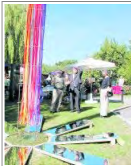
Bitte Bild anklicken!

27 Aussteller boten Blumen und seltene Pflanzen an - Vorträge und Aktionen für Kinder